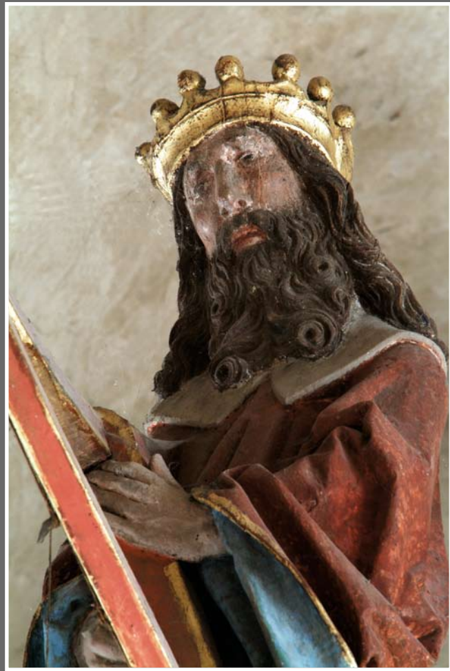
König David mit der Harfe im Auszug des Altars