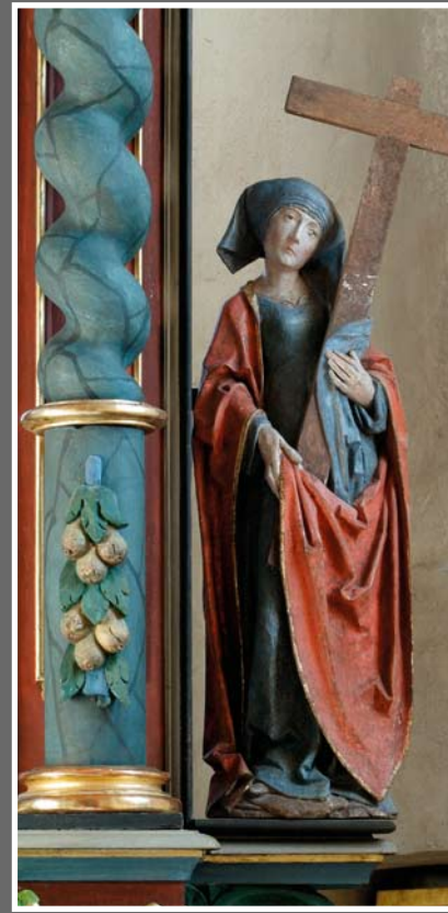
Der Neusitzer Kreuzigungsaltar ist eine Arbeit aus der Riemen-schneider-Werkstatt. Unter dem Gekreuzigten finden sich links seine Mutter Maria, rechts der Apostel Johannes. Als Assistenzfiguren sind links Katharina und rechts Helena, die Mutter Kaiser Konstantins, dargestellt.